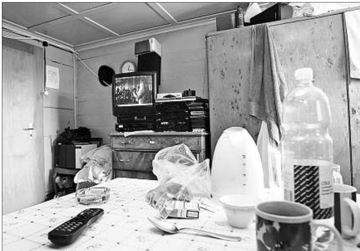
(Fast) frei gestaltbarer Alltag: Die abgewiesenen Asylbewerber dürfen es sich im Flüeli gemütlich machen, müssen sich aber auch an die Hausordnung halten.