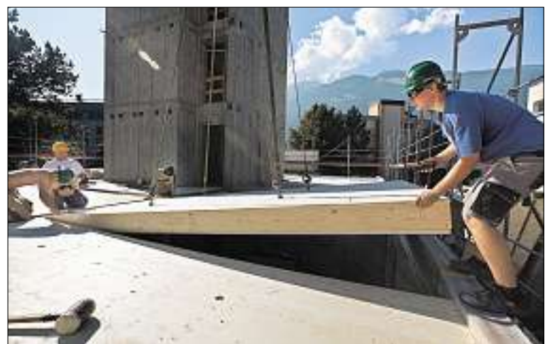
Element um Element: In nur neun Arbeitstagen ist in Chur ein fünfstöckiges Wohnhaus aus Holz entstanden.