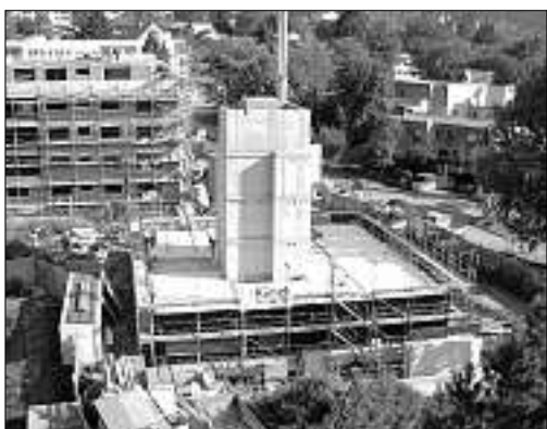
22. September, 16.30 Uhr