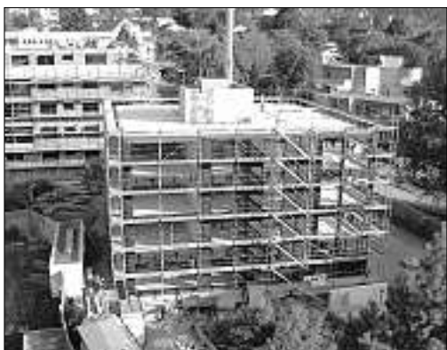
28. September, 16.30 Uhr