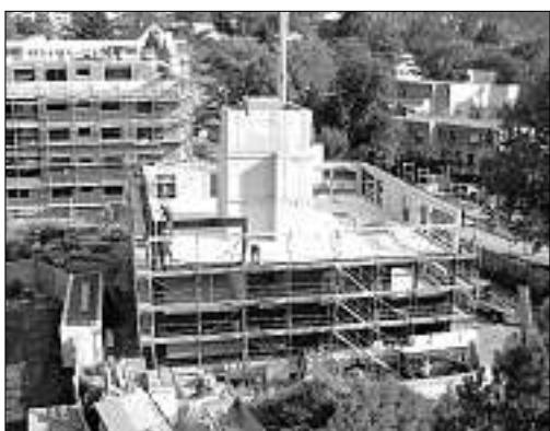
24. September, 16.30 Uhr