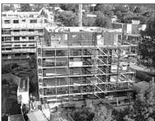
29. September, 16.30 Uhr