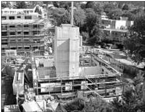
21. September, 16.30 Uhr

Am Montag, 21. September, wurde mit der Montage der ersten Seitenwand des fünfstöckigen Hauses an der Schellenbergstrasse 18 begonnen. Am Mittwoch, 30. September, wurde bereits das letzte Dachelement im Attikageschoss eingefügt. Die ganze Bauphase kann auf der Homepage der Stadt Chur unter www.chur.ch/webcam/archiv nachvollzogen werden.