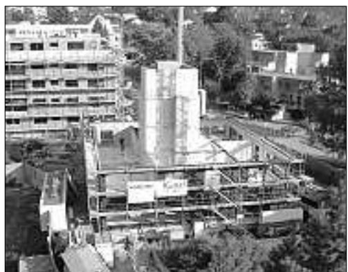
23. September, 16.30 Uhr